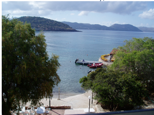
Aussicht vom Hotel

Anmeldung: bis 20. Mai unter Einbezahlung der gesamten Seminargebühr auf das Kto. 7.432.883 (IBAN: AT 3800 0000 0743 2883) RLB, BLZ 38000 (BIC RZSTAT2G), bitte Name und Datum des Seminars anführen.